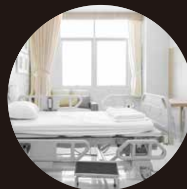
[ 病室/院内設備/寝室など ]