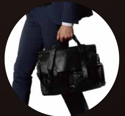
[ 持ち運び便利な超軽量モデル ]