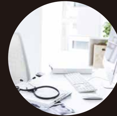
[ オフィス/家庭のデスクトップなど ]