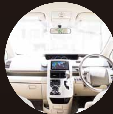
[ 自家用車/タクシー・トラックなどの 商用車の車内に ]