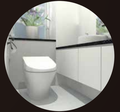
[ トイレ/化粧スペースなど ]