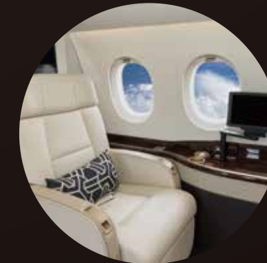
[ 飛行機/新幹線/バスのシート脇に ]